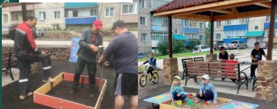
Проект «Олимпия», благоустройство придомовой территории, победитель ТСЖ «Олимп»